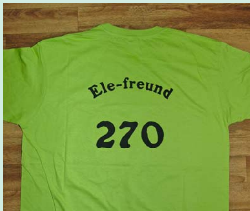
Schnell sichern: Das Elefantenshirt mit exklusiver Rückennummer.