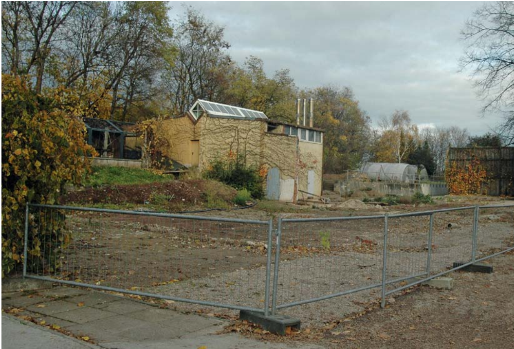
Einst stand hier – zwischen Afrikasavanne und Nashornhaus – das alte Affenhaus. Bald sind auf dem Areal Lemuren zu Hause.