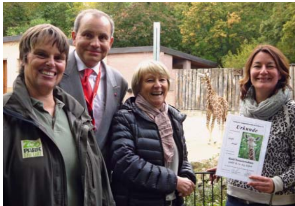
Tierpatenschaft für Giraffe Mayla von Riedel Bau AG Holding