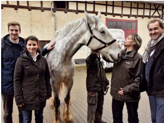
Tierpatenschaft für ein Shire Horse vom Zahntechnikzentrum Eisenach

Auf unser Rätsel der letzten Ausgabe erhielten wir wieder sehr viele Zuschriften. Die Lösung lautete: „Kronenkranich“.