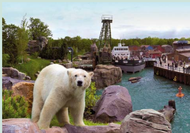
Auge in Auge mit Eisbären in der Yukon-Bay, ein Erlebnis besonderer Art, erwartet die Teilnehmer der Zoofahrt nach Hannover.

■ Lutz Asmus