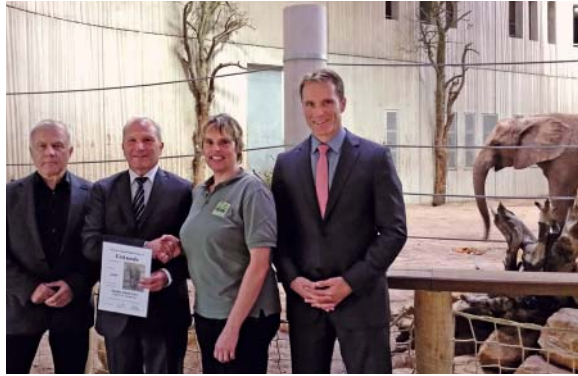
Tierpatenschaft für Elefant Chupa vom Autohaus Glienicke