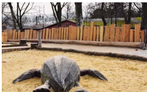
Eine von den Erfurter Zooparkfreunden finanzierte „Lange Bank“ dient als Abgrenzung und Ruhezone zugleich. Sie hat eine Länge von 33 Metern und verfügt über 5 Lehnen.